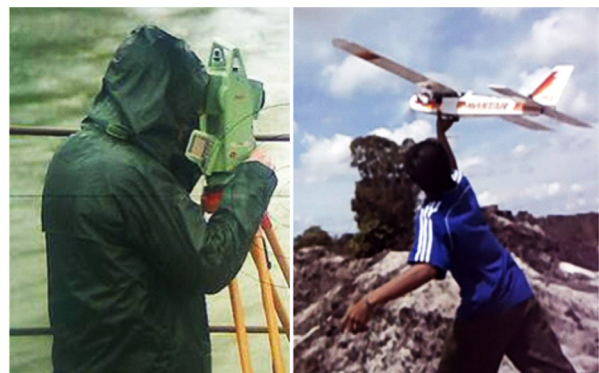
Gambar 1. Ilustrasi tim land-surveyor dan tim surveyor fotogrametri.

Tulisan ini memperkenalkan ide pemanfaatan WUTA dalam bentuk tim surveyor fotogrametri untuk memenuhi kebutuhan produksi peta kadaster di BPN. Tim surveyor ini didefinisikan sebagai suatu tim teknis yang memiliki kompetensi untuk memproduksi data geospasial secara mandiri yang dilakukan dengan teknologi fotogrametri digital dan kamera digital sebagai sensor pencitraan yang dibawa oleh Wahana Udara Tanpa Awak (WUTA). Data geospasial yang bisa diberikan adalah citra ortofoto resolusi tinggi, dan model elevasi digital dari suatu obyek/kawasan. Ilustrasi tim ini adalah seperti halnya tim land-surveyor dengan perangkat total station atau RTK-GPS ( Real-time Kinematic Global Positioning System ), maka tim surveyor fotogrametri membawa perangkat kamera digital yang ditempatkan pada wahana udara atau darat yang portabel (lihat Gambar 1). Selanjutnya tulisan ini akan menggambarkan lebih mendetail yang meliputi arsitektur sistem dan sejumlah contoh kasus pemanfaatannya, dan diskusi kelebihan dan kelemahan teknologi ini secara praktis.