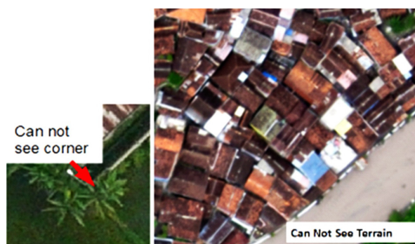
Gambar 2. Ilustrasi keterbatasan kemampuan survei dari udara.