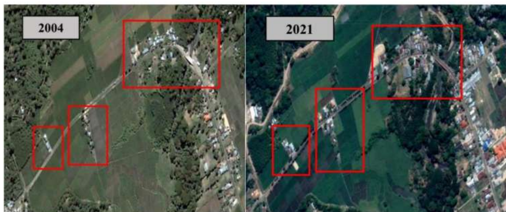
Gambar 3. Alih fungsi Lahan Pertanian di Desa Nanga Labang

Kondisi kepemilikan tanah di Desa Nanga Labang bukan satu-satunya persoalan. Akibat kebutuhan akan tanah yang terus meningkat, kondisi yang perlu menjadi perhatian di antaranya ialah alih fungsi lahan (Hastuty, 2017; Purwanti, 2018). Lahan pertanian terutama sawah di dataran rendah Wae Reca dan Tambak merupakan salah satu penghasil beras yang menjanjikan namun saat ini alih fungsi terhadap lahan pertanian tersebut mulai terjadi. Alih fungsi ini terutama terjadi pada bidang tanah sawah yang terletak di pinggir jalan negara. Pemanfaatannya cukup beragam yakni untuk kegiatan usaha, gudang maupun untuk perumahan. Gambaran alih fungsi lahan di Desa Nanga Labang dari tahun 2004 sampai tahun 2021 dapat dilihat pada Gambar 3.