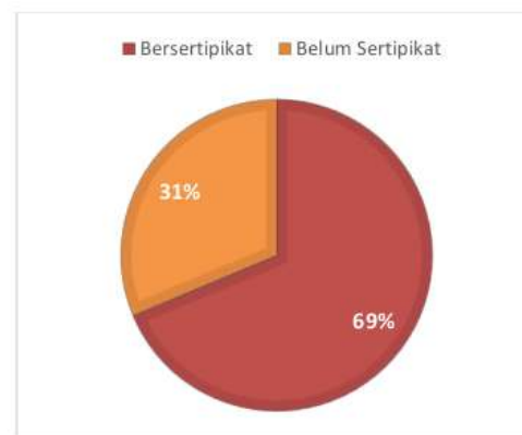
Gambar 2. Diagram Perbandingan Luas di Desa Nanga Labang

Sebagaimana pranata dan lembaga adatnya yang hampir hilang, tanah Ulayat di Desa Nanga Labang telah habis dibagi melalui pembagian adat bahkan sebelum pertumbuhan populasi Desa Nanga Labang berkembang. Menurut data Kantor Pertanahan Kabupaten Manggarai Timur, saat ini terdapat sebanyak 1.257 bidang tanah bersertifikat di Desa Nanga Labang. Adapun sertifikat hak milik yakni sebanyak 1.253 meliputi area seluas 3.641.930 m 2 , terdapat pula sebanyak 2 sertifikat HGB dengan total luas 13.071 m 2 serta 2 sertifikat HP yang meliputi area seluas 13.298 m 2 . Perbandingan luas tanah bersertifikat dengan luas wilayah Desa Nanga Labang dapat dilihat pada diagram.