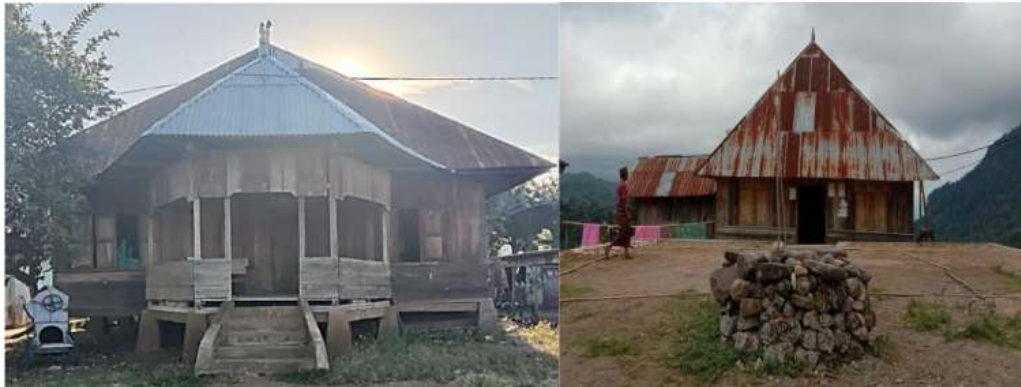
Gambar 1. Mbaru Gendang Toka di Desa Nanga Labang (kiri) dan Mbaru gendang Ledas di Desa Rondo Woing (kana).